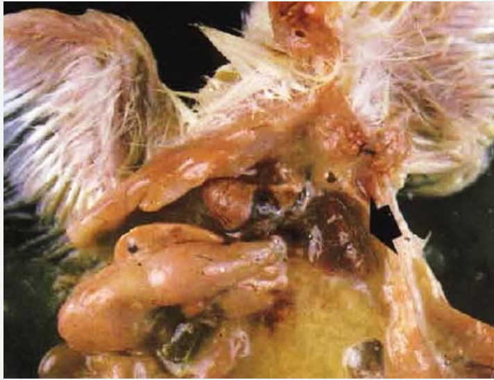
صورة رقم (5)

قد تصبح محتويات كيس المح ذات قوام سميك اذا بقي الصوص حيا حتى الاسبوع الثاني من العمر. تلتصق هذه الاكياس غالبا الى جدار البطن الخلفي ويمكن جسيها بالطائر الحي او تلتصق الى الاحشاء. احيانا يصادف عند تشريح الطيور باعمار متقدمة وجود بقايا كيس المح المخموج محتويا على مواد متجبنة داكنة اللون.