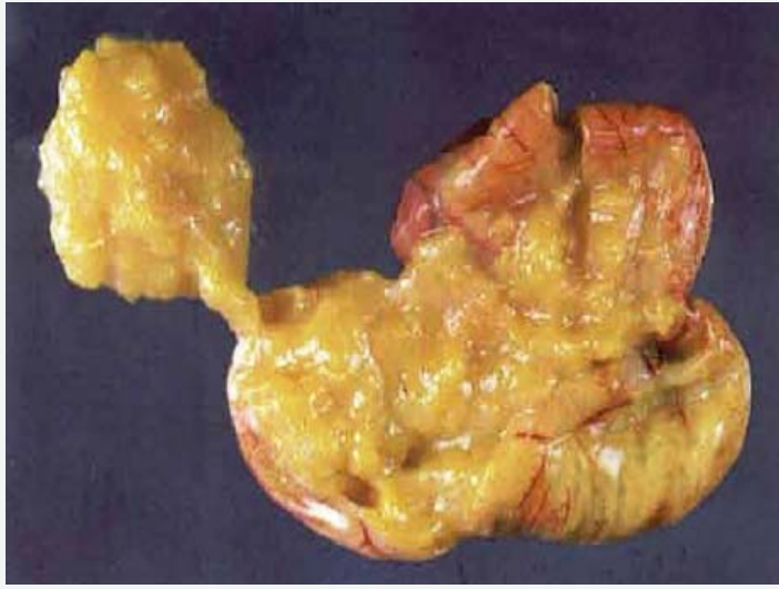
صورة رقم (4)

قد تصبح محتويات كيس المح ذات قوام سميك اذا بقي الصوص حيا حتى الاسبوع الثاني من العمر. تلتصق هذه الاكياس غالبا الى جدار البطن الخلفي ويمكن جسيها بالطائر الحي او تلتصق الى الاحشاء. احيانا يصادف عند تشريح الطيور باعمار متقدمة وجود بقايا كيس المح المخموج محتويا على مواد متجبنة داكنة اللون.