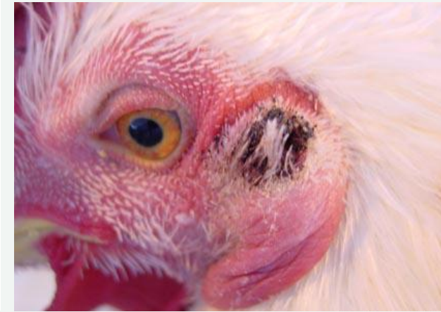
صورة رقم (3)

يلاحظ بهذه الصورة انتفاخ بالفتاه الاذنية للطائر نتيجة الاصابة بكتوليرا الطيور بشكل مزمن.