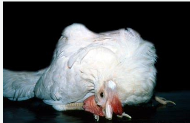
صورة رقم (4)

يلاحظ بهذه الصورة حدوث التواء بالرقبة والراس نتيجة للاصابة المزمنة بالكوليرا. هذه الاعراض علامة على العدوى السحائية.